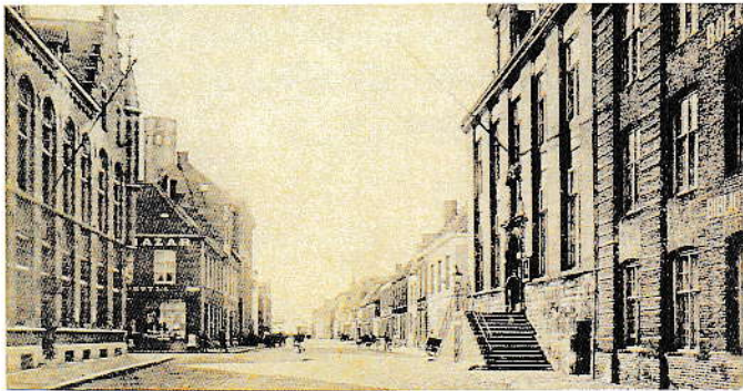
Rechts het stadhuis zoals in de 17de eeuw

Cathelyne Bogaert zag op de avond van Allerheiligen in het jaar 1647 bij kaarslicht, tien tot twaalf keer een beest in de gedaante van een zwarte kat vlug heen en weer lopen in haar slaapkamer. Omdat de kamerdeur en het raam van de slaapkamer gesloten waren, wist Cathelyne niet waar dat beest vandaan was gekomen en uiteindelijk naartoe was gegaan.