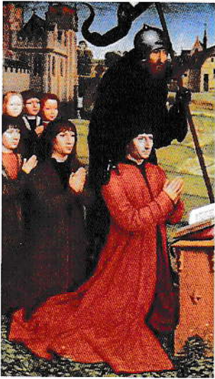
Hans Memling. Vooraan Willem III met naast hem Willem IV.

Toch werd het voor hem weer benard in 1483 als burgemeester, zodat hij zich in Doornik terugtrok !